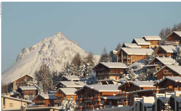
Village de Valberg